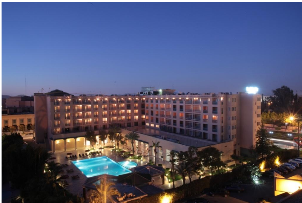
Hôtel Ryad Mogador Menara

nationaux résidants hors Marrakech, seront logés gratuitement dans des résidences à 18 (diner) au 22 (déjeuner) Novembre 2014. A condition que la demande d'hébergement et de restauration soit faite expressément sur le bulletin d'inscription.