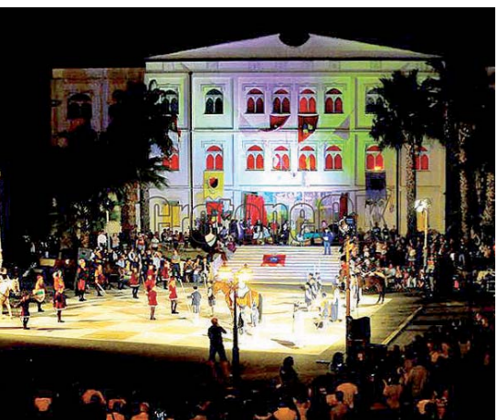
La partie d'échecs vivants.

pace, mais leurs Fous n'ont pas de bonnes diagonales.